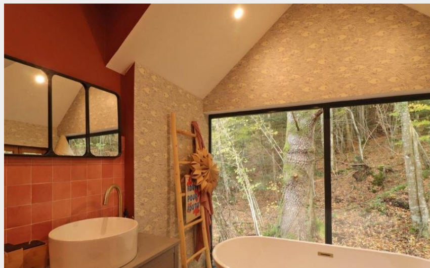
Crédit photo : Casa Rosalie - "La Casa Slow" (© Gîtes de France Orne)