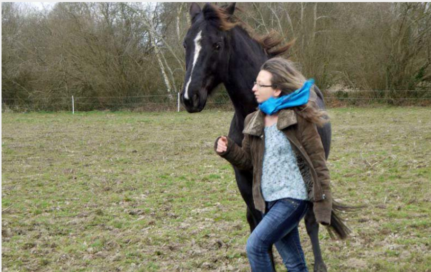
Crédit photo : Danse avec ton cheval - Montmerrei (©Laurence Fabre)