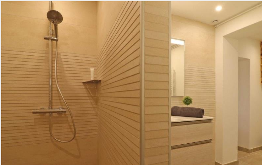
La fermette de la Robinière