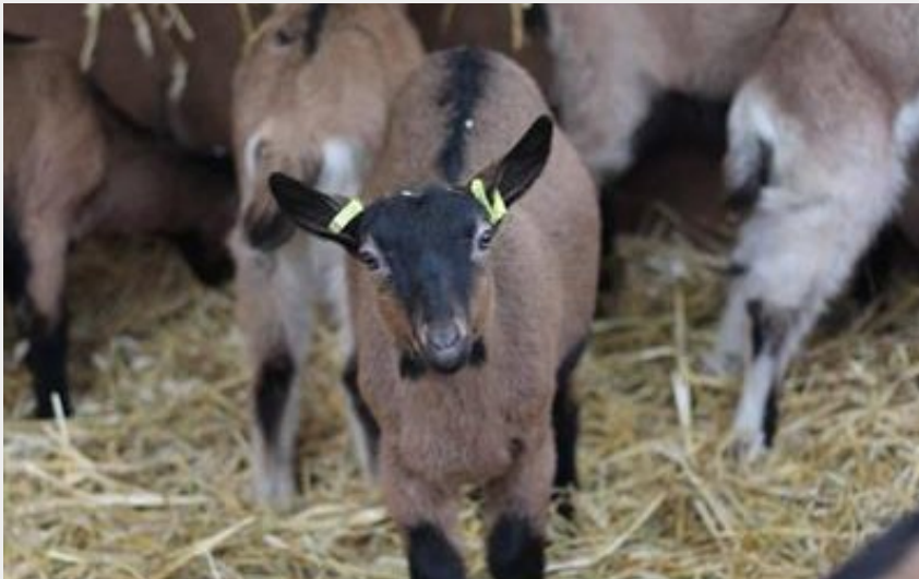
La Cabane de Jabi