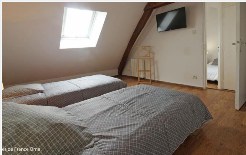
Gîtes de France Orne