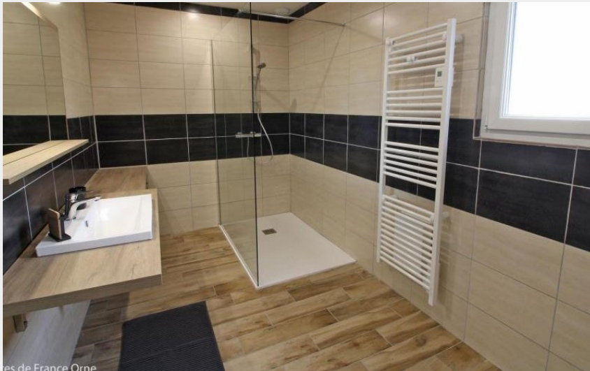
Gîtes de France Orne