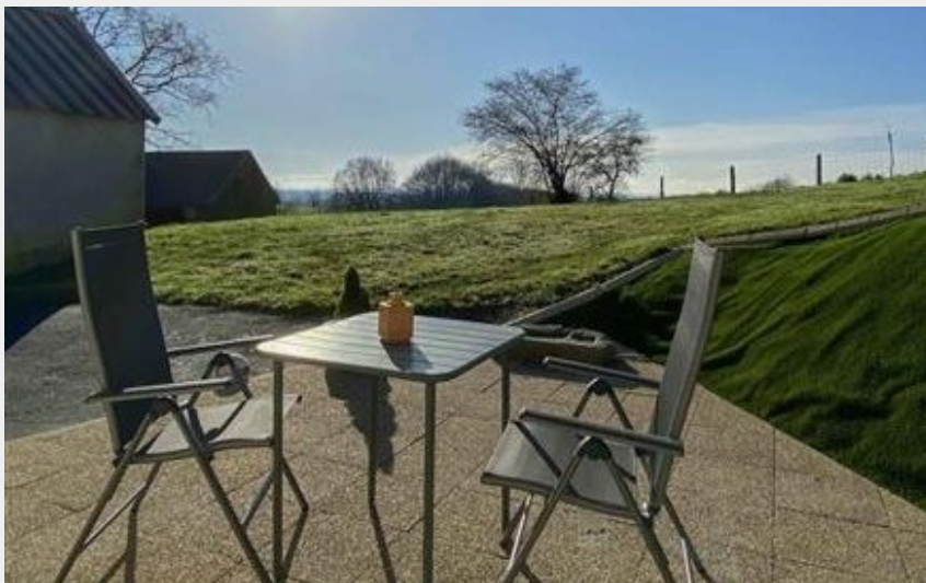
Belle vue - La Haute Boissière