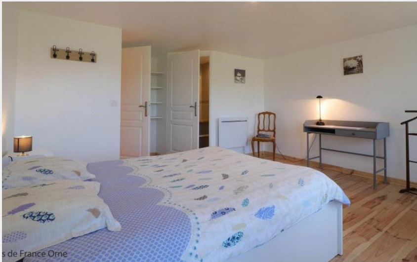
s de France Orne