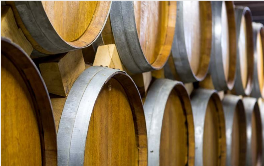
Maison Périgault - Silly en Gouffern