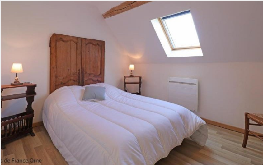
s de France Orne

Crédit photo : Le Petit Magasin (© Gîtes de France Orne)