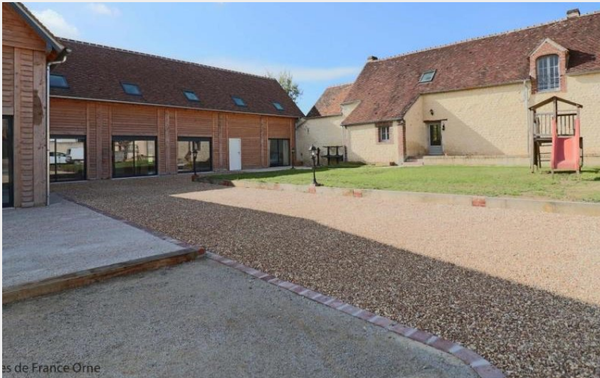
Gîtes de France Orne