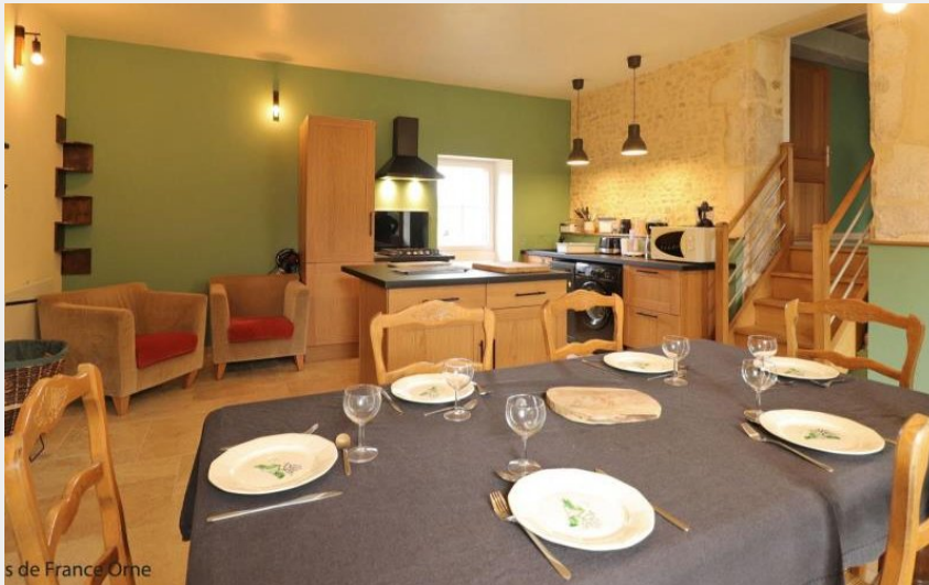
s de France Orne