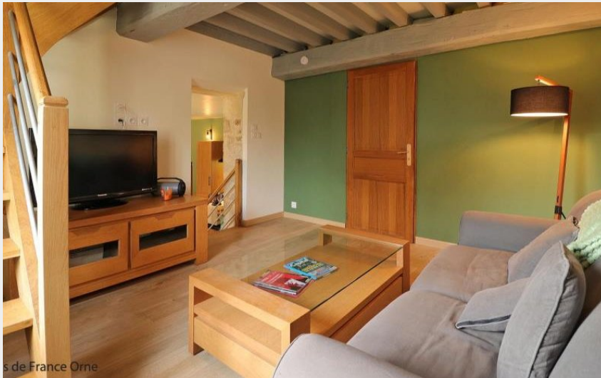
s de France Orne