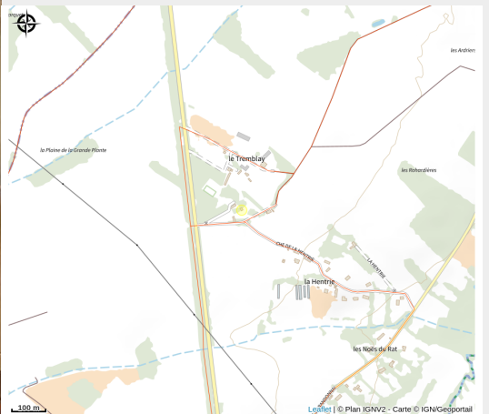
La Maison d'ELGA - Le Tremblay