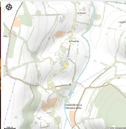
Crédit photo : Cottage-du-coudray-la-Fresnaie-Fayel (© TOURISME 61)