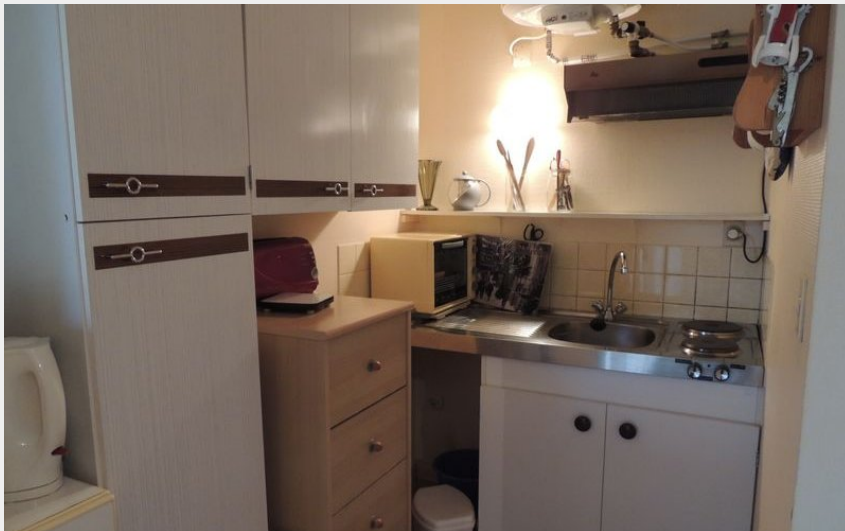
Crédit photo : meuble-96-residence-vieux-moulin-bagnoles-de-l-orne (© orne tourisme)