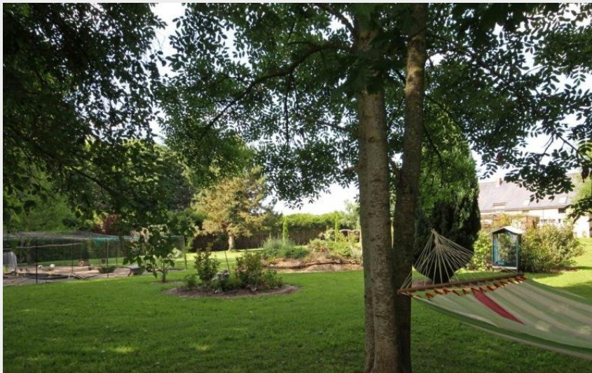
Le champ de la planche à l'âne