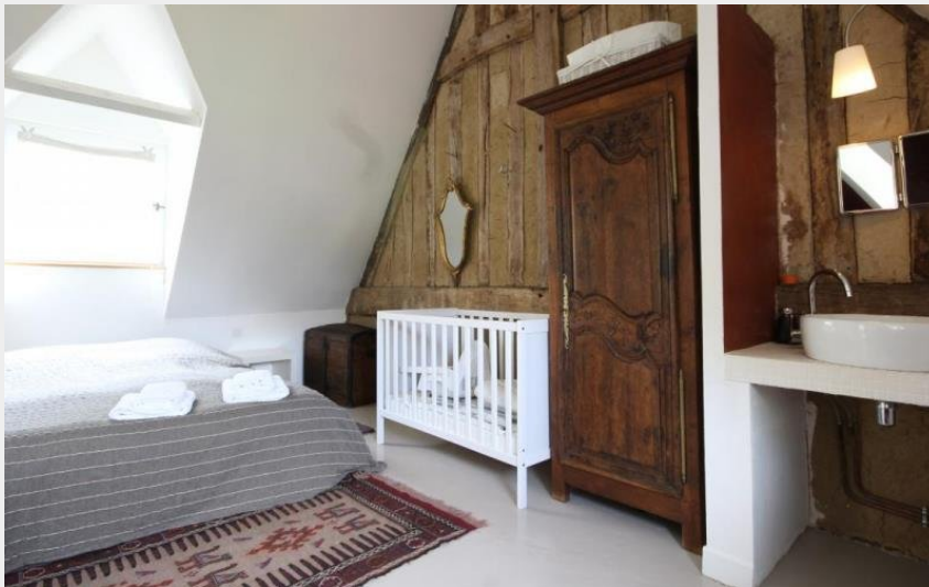
Crédit photo : L'Oisellerie - L'étang cottage (© Gîtes de France Orne)