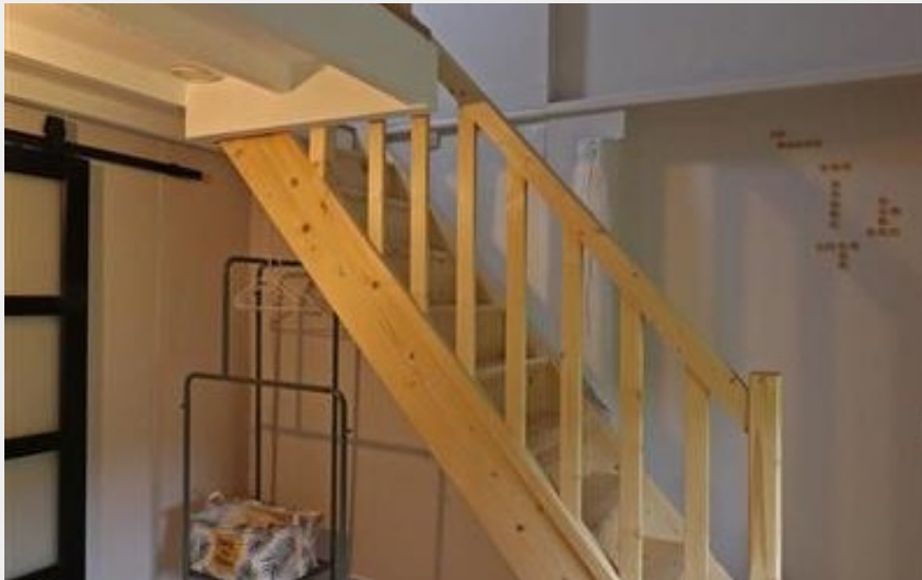
Crédit : Gîtes de France Haras Sainte-Eugénie (© Gîtes de France Orne)