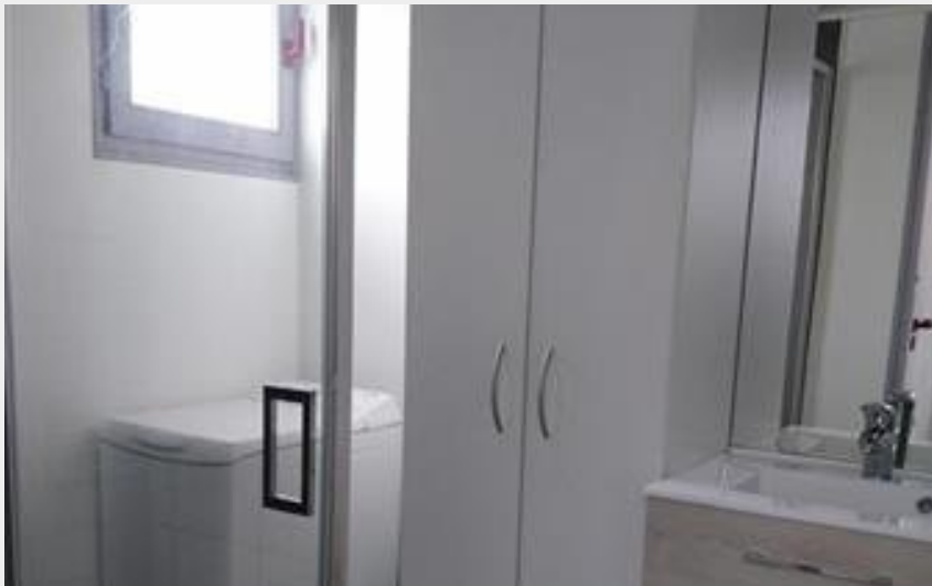
Chalet N°4 du chemin de la Lande