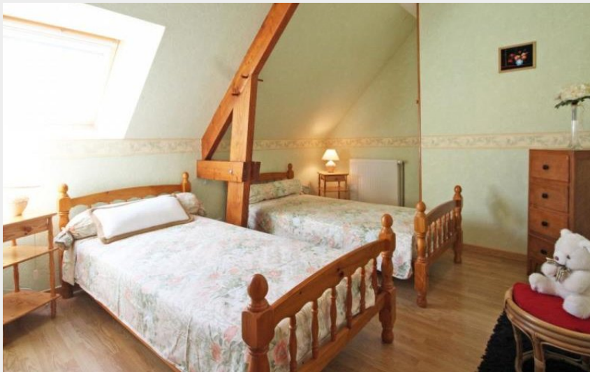
La Raillère - le grand gîte