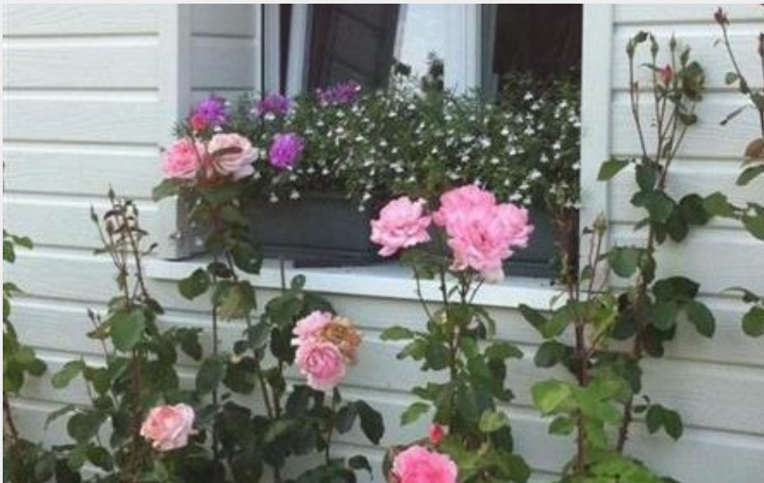
La Petite Maison - Le Hoguet