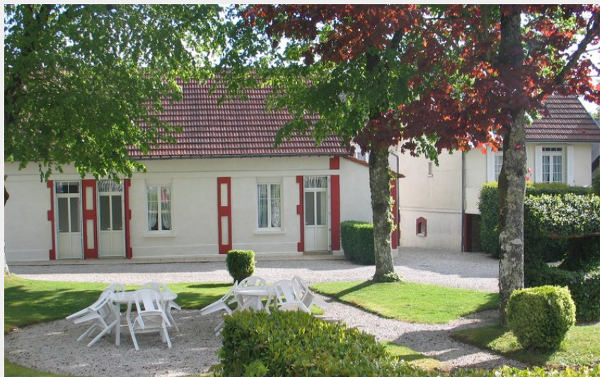
Les anémones MmeLECELLIER exterieur