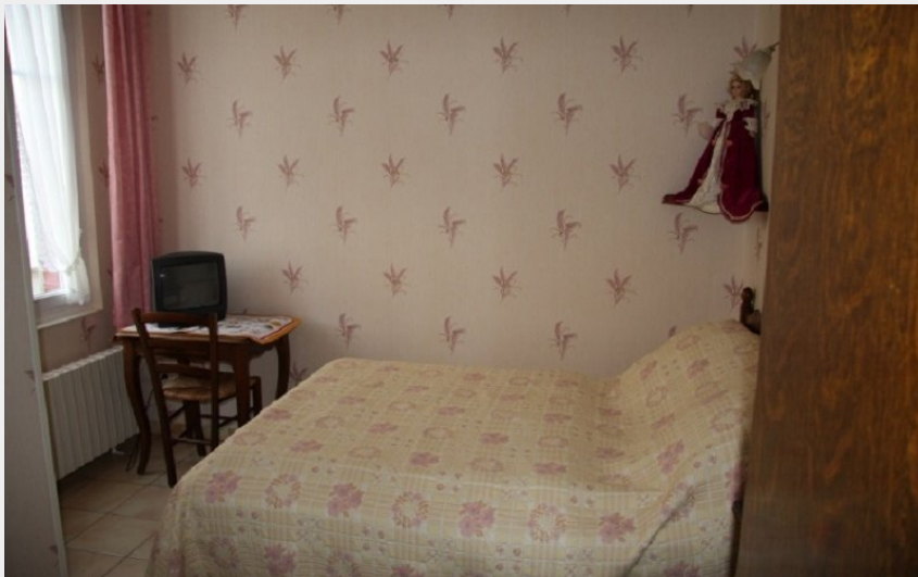
1- Les anémones MmeLECELLIER chambre