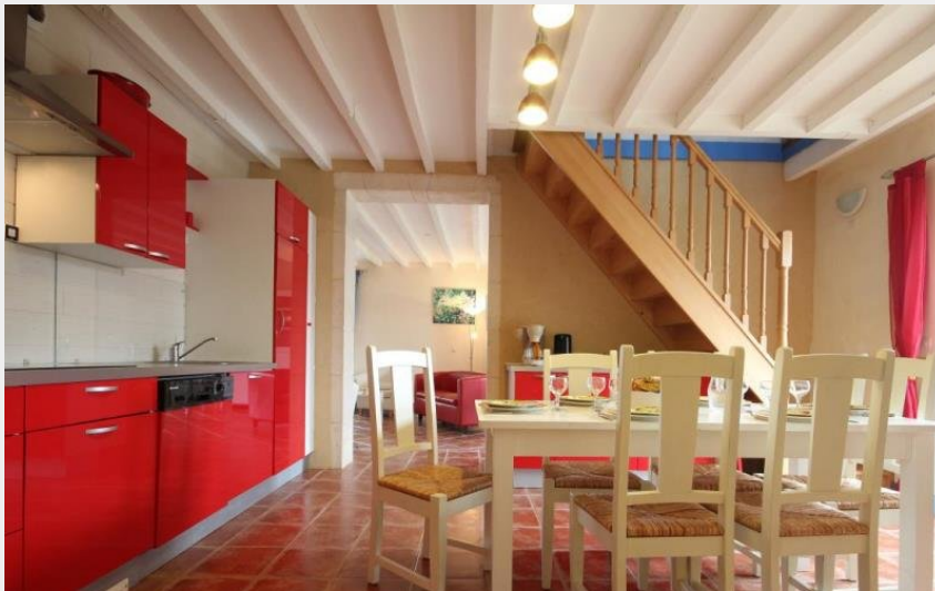
Crédit photo : Launay - Gîte des 4 saisons (© Gîtes de France Orne)