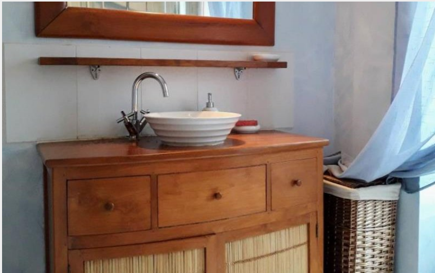
Crédit : Gîtes de France Maison du Jardinier (© Gîtes de France Orne)