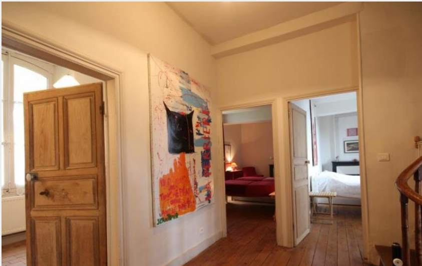
Le Presbytère - La Perrière